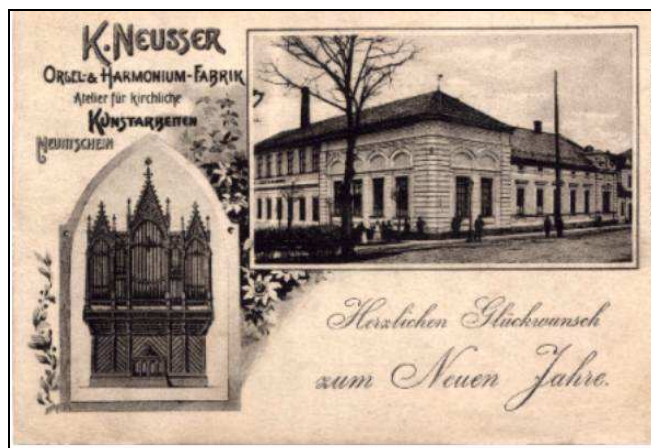
Novoroční pohled z novojičínské továrny