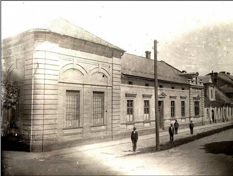
Pohled na továrnu v době provozu – obr. 2