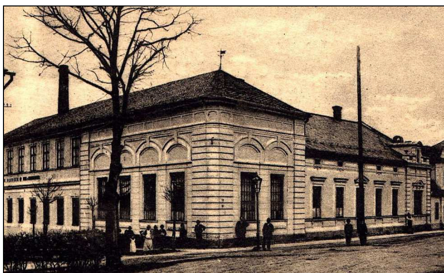
Pohled na továrnu v době provozu – obr. 1