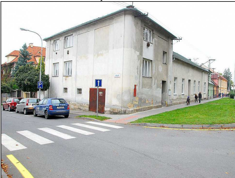
Současná podoba domu (Nový Jičín, dnešní křižovatka ulic Jiráskova a K nemocnici)