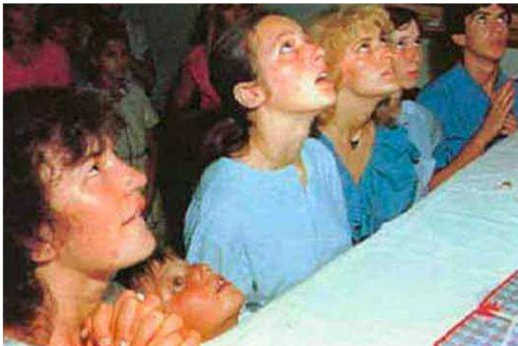
Vizionáři na začátku zjevení

Medžugorie - asi 1000 km od České republiky, je jedno místo v chorvatské části Bosny a Hercegoviny. Asi 20 km od starobylého Mostaru, je dnes jedno z největších poutních míst na světě, kde ročně statisíce lidí, věřících i nevěřících z celého světa, nacházejí radost, klid a mír do duše, úsměv na tvář, tělesná a duševní uzdravení, kde je prostě lidem dobře a pohodově, kde se ztrácí mezi lidmi různost jazyků, vzdělání a postavení, kde se 24. června 1981 zjevila a dále zjevuje 6 dětem – vizionářům, dnes již dospělým lidem, kteří mají své rodiny a žijí po celém světě, Matka Boží – Panna Maria.