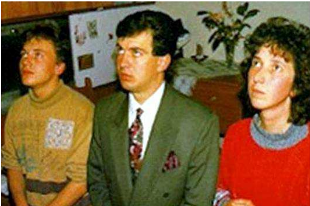
Vizionáři Marja, Ivan a Jakov při zjevení