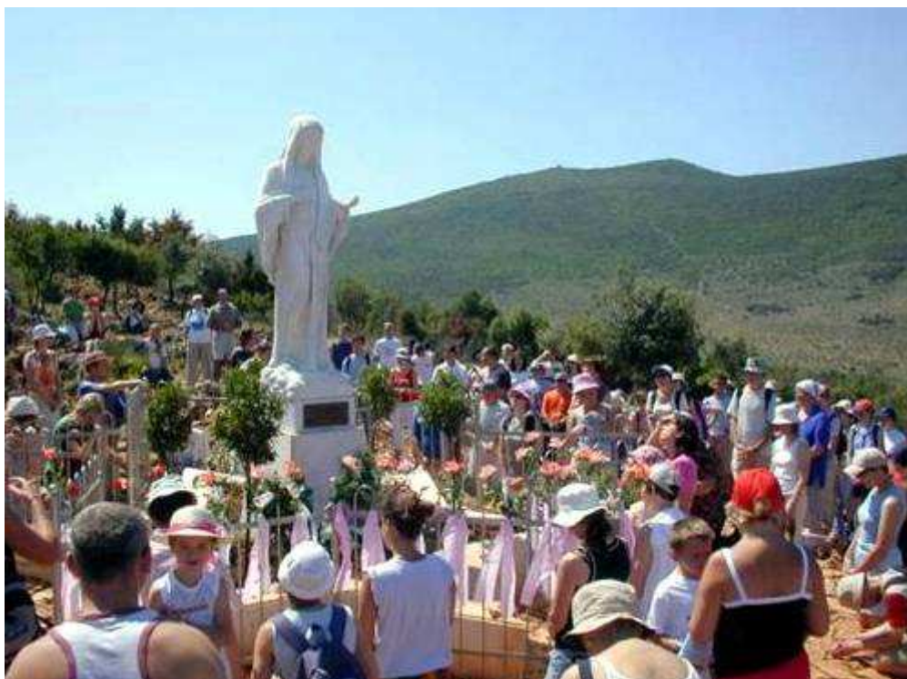
Místo prvního zjevení – kopec Podbrdo