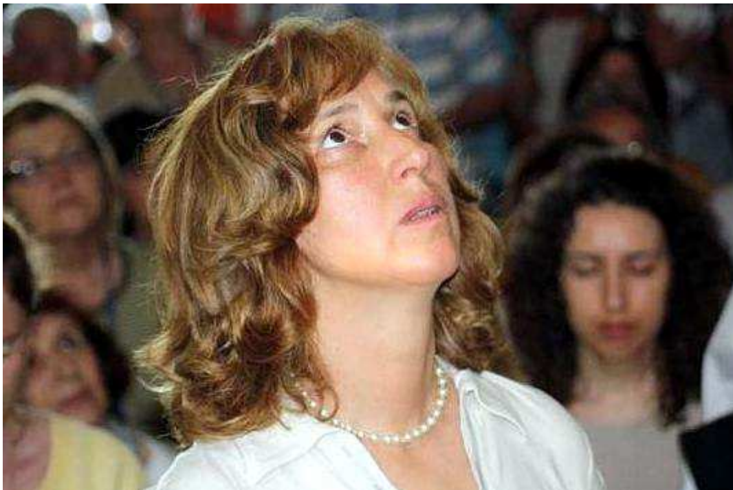
Vizionářka Marija při zjevení