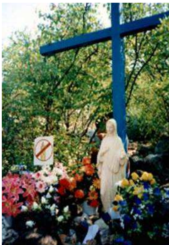
Místo Mordý kříž